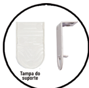
SUPTORES Tampa do suporte