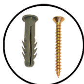
BUCHAS E PARAFUSOS